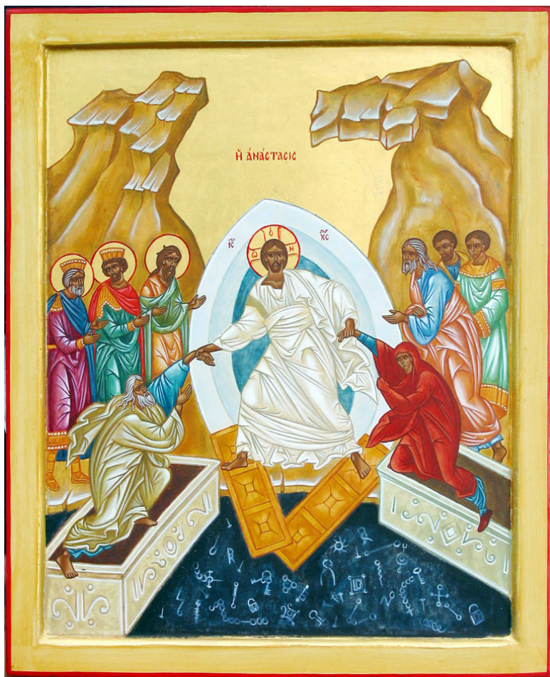
Icône : La Résurrection - Atelier saint André